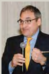
L'Honorable Martin Cauchon, cp, parent et président d'honneur de l'OMNIUM 2014

En 2014, c'est sous la présidence d'honneur de l'Honorable Martin Cauchon, cp, qu'avait lieu la 20 e édition de l'Omnium Brébeuf. Grâce à cet événement, le Fonds de développement a pu amasser plus de 60 000 $ au profit des bourses d'aide du Collège.