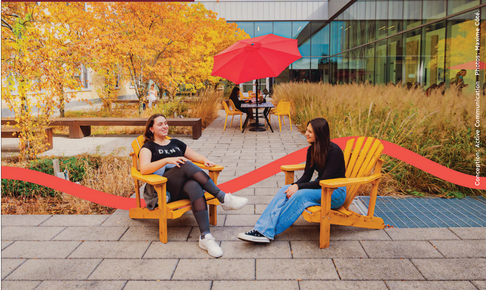
Conception: Active Communication - Photos: Maxime Côté.

Consultez le site du Collège pour obtenir plus d'information sur les programmes et les journées portes ouvertes.